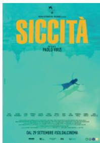
23 SICCITÀ Paolo Virzì