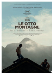
13 LE OTTO MONTAGNE Felix Van Groeningen Charlotte Vandermeersch