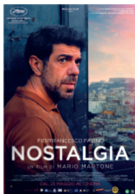
11 NOSTALGIA Mario Martone