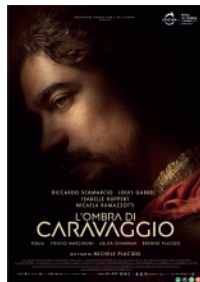
27 L'OMBRA DI CARAVAGGIO Michele Placido