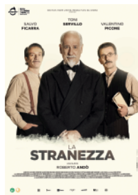
15 LA STRANEZZA Roberto Andò